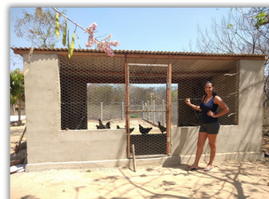
Construção / Reforma de Galinheiros