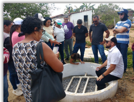
Visita de Intercâmbio, comunidade quilombola Santa Rosa, Boa Vista - PB