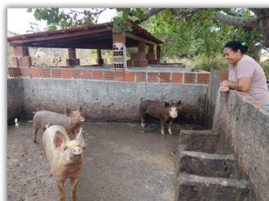
Construção / Reforma de Pocilgas