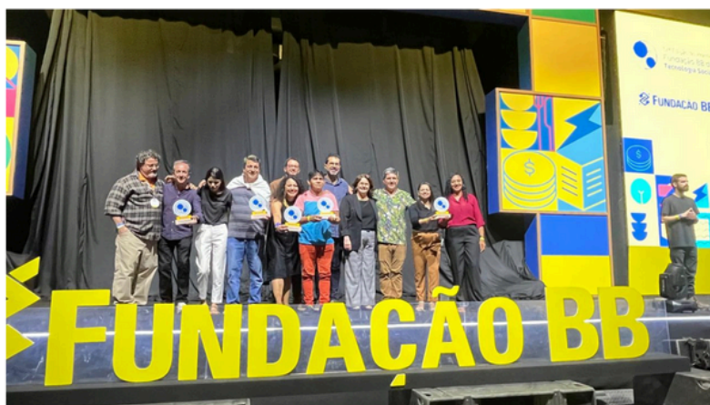
Cerimônia de Premiação da Fundação Banco do Brasil, Brasília- DF