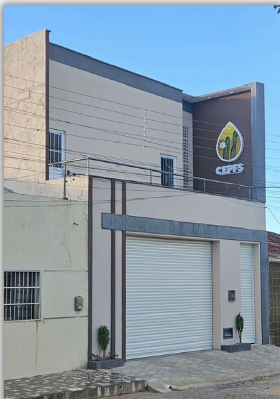
Construção da Sede do CEPFS - Teixeira - PB