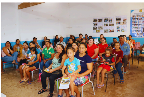
Roda de Conversa, comunidade Mata Grande dos Alves, Imaculada - PB