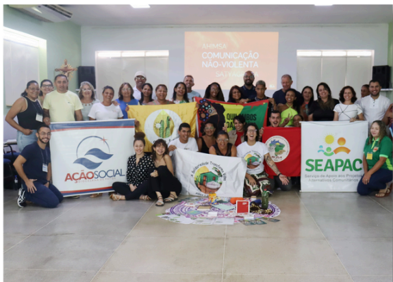
Oficina de Comunicação Não Violenta, Patos - PB