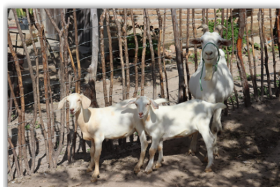
Construção / Reforma de Apriscos