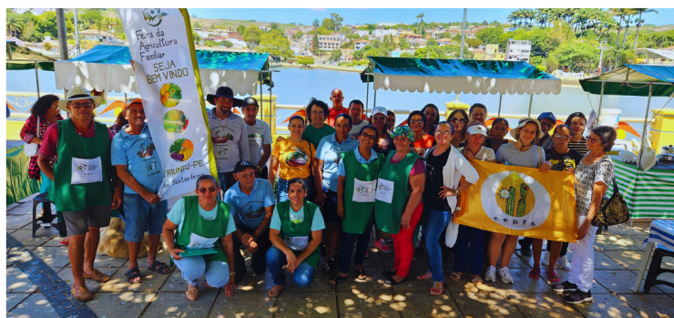
Intercâmbio Regional Triunfo-PE