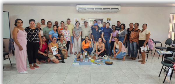
Visita de Monitoramento e Avaliação da Fundação Interamericana