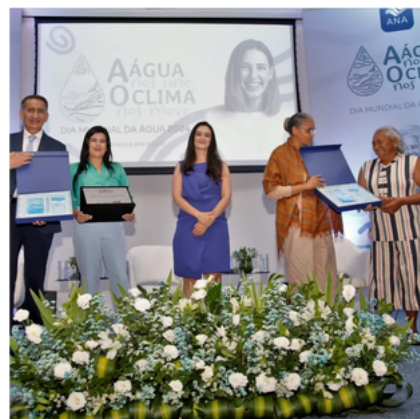
Homenagem ao CEPFS no Dia Mundial da Água, pela Agência Nacional de Águas - Brasília - DF