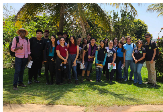
Visita Área Experimental do CEPFS