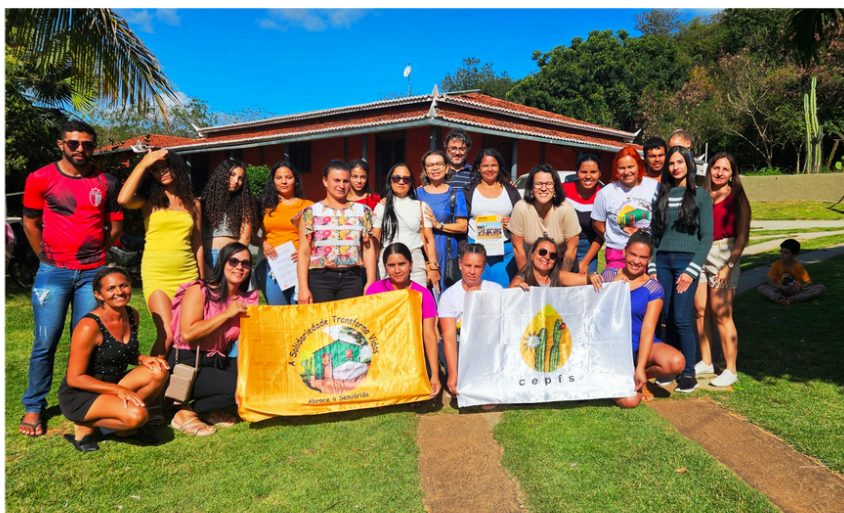
Oficina de Comunicação Não Violenta