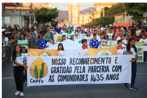
Homenagem das Escolas Rurais do Município de Teixeira ao CEPFS.